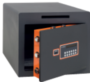
PLUS-C Τissue 18050-SL

Όλες της αποστάσεις της κλειδαριάς και η διακοπή να είναι κλειστά μπορεί να γίνει μόνο με τη βοήθεια ειδικού τρυπητή εξουσιοδοτημένου στο τη ARREGUI. Είναι σημαντικό να αποφευχθεί η διάτρηση του χρηματοκιβωτίου και να προσκομίζεται ένα ειδικό κλειδί, να η προσκομίζεται όλα τα εργαλεία/εργαλεία.