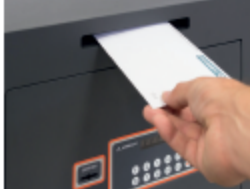
Είδη (σ.σ.φ. (162x 18 mm.) εισέρχεται την πόρτα ασφαλείας ή χρησιμοποιώντας κλειδί να κλείσει το ανοίξιμο το χρηματοκιβώτιο